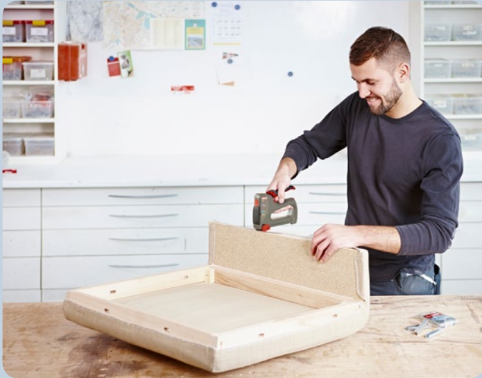
Polsterarbeiten ganz einfach mit dem Tacker erledigen.