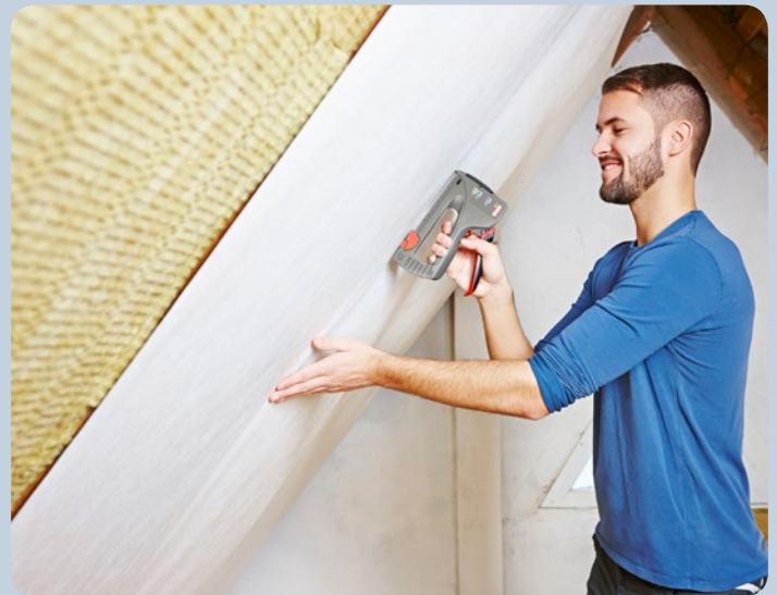
Folie beim Dachbodenausbau einfach befestigen.