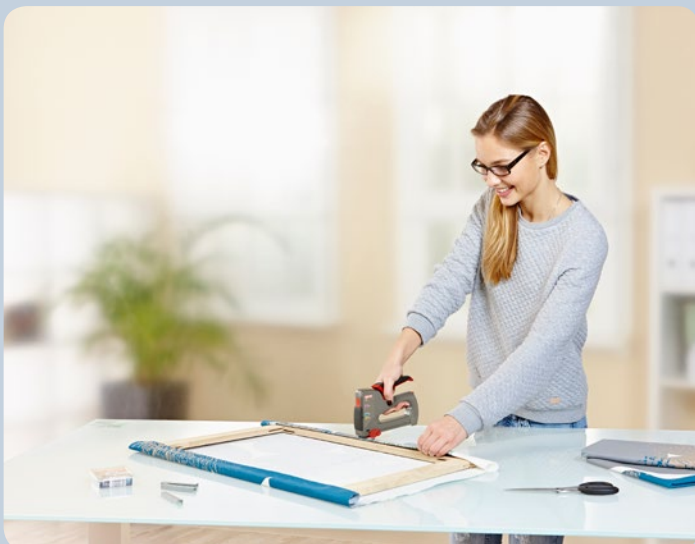
Schnelles Bespannen von Bilderrahmen.