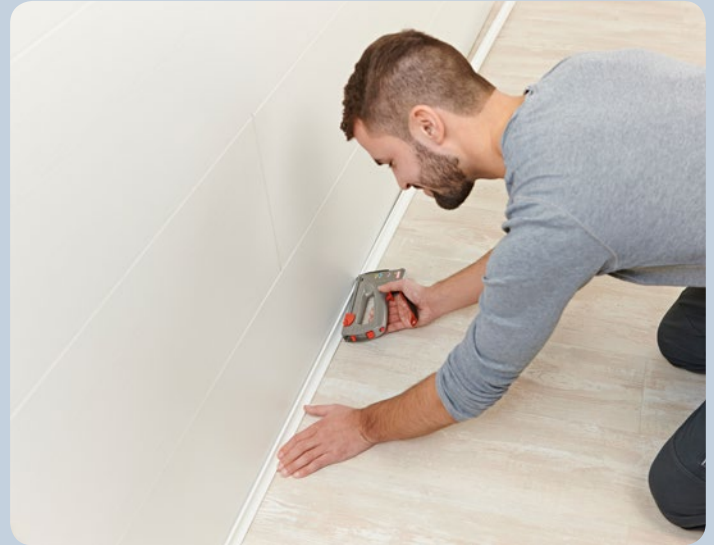
Zierleisten können schnell und einfach getackert werden.