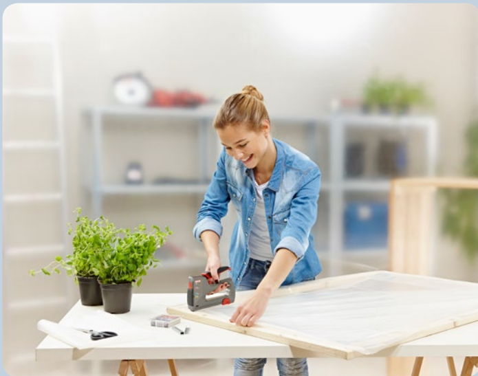
Schnelles Befestigen von Folie.